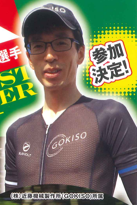
(株)近藤機械製作所(GOKISO)所属